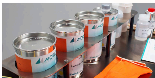
Halterungen für Farbdosen und Hilfsmittel

Optimiert für den Einsatz beim Tampondruck, ist der MW700 3.0 ausgestattet mit Fächern zur Aufbewahrung von Hilfsmitteln, Tampons, Werkzeugen und vielem mehr. Für Reinigungsarbeiten ist außerdem ein Papier-Handtuch-Halter integriert.