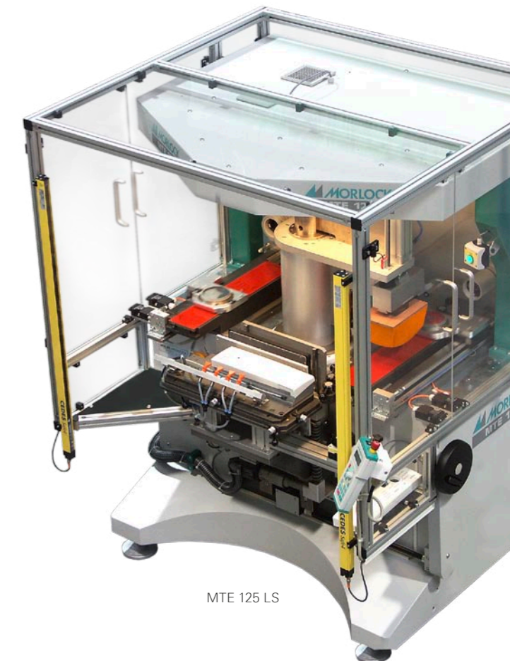
MTE 125 LS

Wie alle Maschinen aus der MTE-Baureihe hat die MTE 125 LS einen höhenverstellbaren Winkeltisch , eine Klischeeverstellung (X-Y-Winkelposition) und eine abgestimmte Druckkraftanpassung .