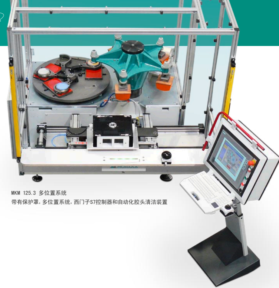
MKM 125.3 多位置系统 带有保护罩，多位置系统，西门子S7控制器和自动化胶头清洁装置

这些技术参数提供印刷时的状态 为了进一步升级连续程序，我们预留需要的改进技术参数。受偏差和差错支配