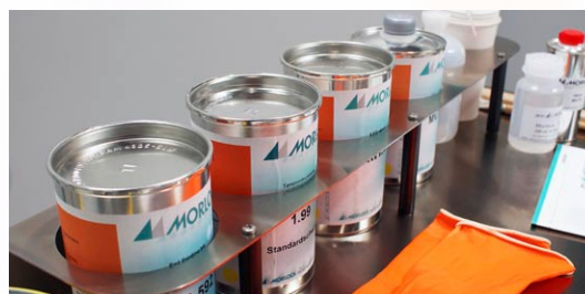
Rack pour les encres et les aditifs auxiliaires

Optimisé pour les utilisateurs de machine d'impression, le nouveau MW700 2.0 est équipé d'étagères pour stocker les produits auxiliaires, tampons, des outils et plus encore. Pour les travaux de nettoyage, un support de serviette de papier est également intégré.