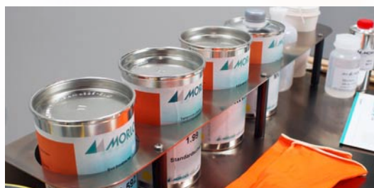
Halterungen für Farbdosen und Hilfsmittel

Optimiert für den Einsatz beim Tampondruck, ist der MW700 2.0 ausgestattet mit Fächern zur Aufbewahrung von Hilfsmitteln, Tampons, Werkzeugen und vielem mehr. Für Reinigungsarbeiten ist außerdem ein Papier-Handtuch-Halter integriert.