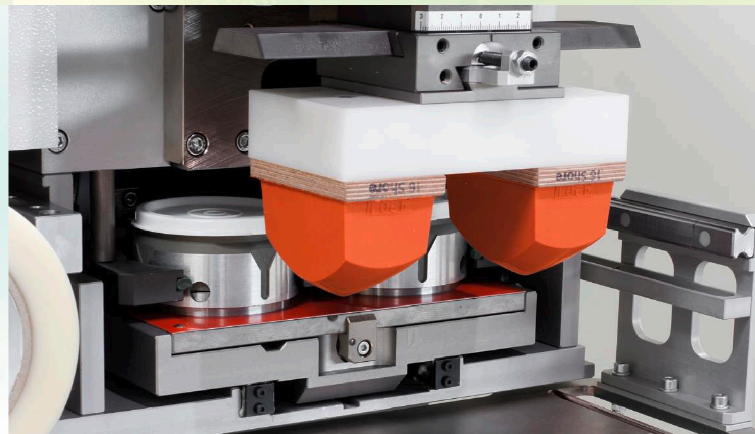
NEU! MSC 100.2-2 mit Doppeltopf