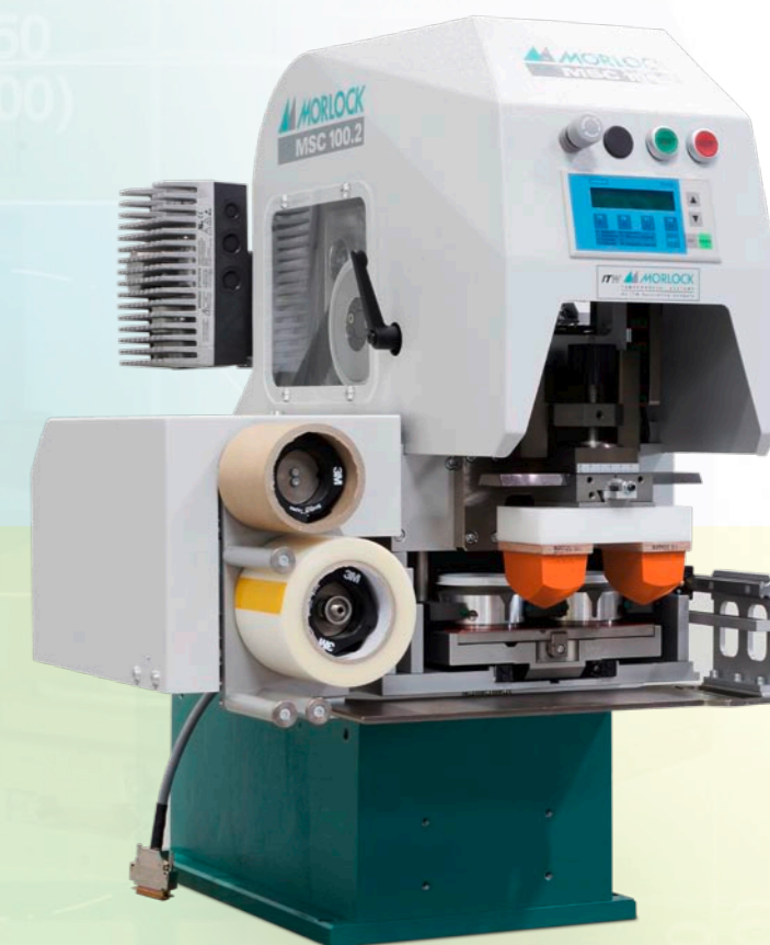
MSC 100.2-2 (mit Doppeltopf)