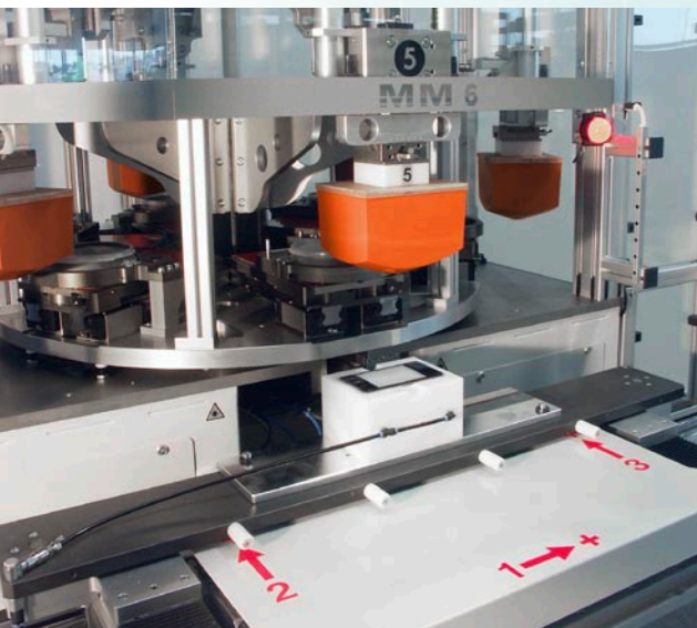
Image de gauche: la position de la pièce à usiner est corrigée par le biais des axes 1, 2 et 3. Une correction d'angle est en outre réalisée grâce à un déplacement opposé des axes 2 et 3.

Le système est également adapté pour l'impression de grandes pièces à usiner étant donné que différentes positions peuvent être déterminées.