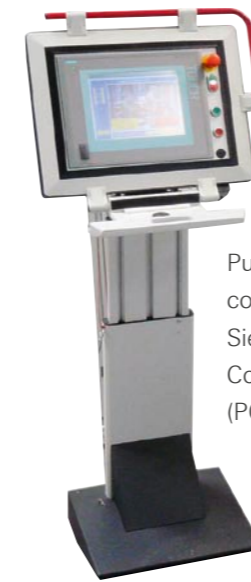
Pupitre de commande Siemens S7 Commande (PC industriel)