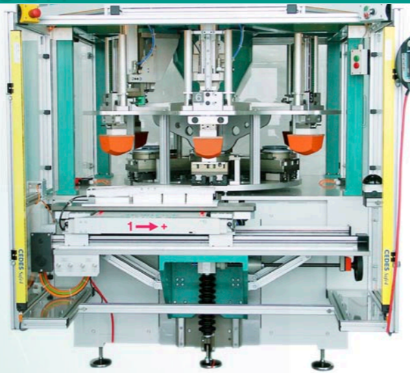
MM6 avec commande Siemens S7

Sur demande, le système MM6 peut être individuellement adapté. Le domaine d'application du système d'impression fiable ne se limite donc pas uniquement au poste de travail manuel classique. Une intégration dans des automatisations est avant tout parfaitement réalisable avec le système MM6.