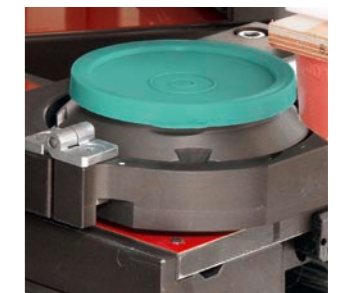
Patentierter MCI-Farbtopf (geschlossenes Farbgebersystem)