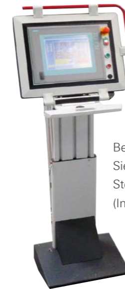
Bedienpanel Siemens S7 Steuerung (Industrie-PC)