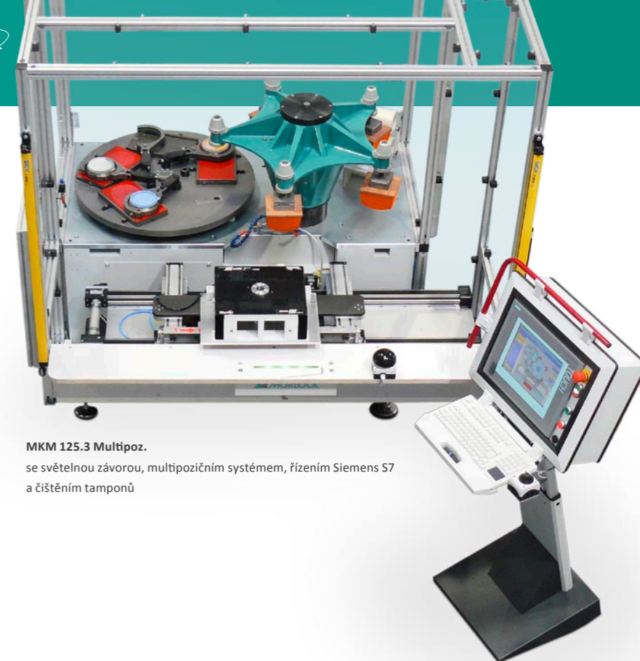
MKM 125.3 Multipoz.

Uložení parametrů soutisku elektronicky řízeného stolu do paměti počítače podstatně zkrátí seřizovací časy při opakovaných zakázkách.